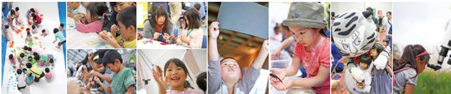
※ 写真は過去のワークショップのものです。当日の実施内容とは異なることがあります。