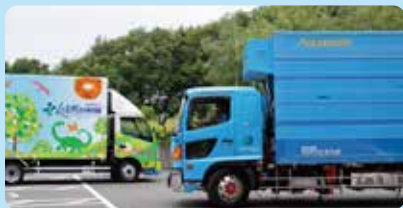
移動水族館「アクアラバン」と、移動博物館車「ゆめはく」も来るよ

蚊帳 (かや) の中で、トンボやちょうちょとあそぼう！ イモリやタガメ、ヘラクレスオオカブトをさわってみよう！