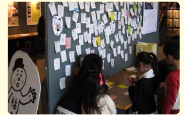
▲「みんなの福島展」では会場と福島の子どもたちとメッセージ交換をしました。