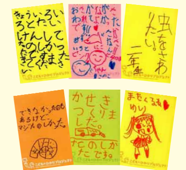
▲「子ども☆ひかりフェスティバル」仙台・福島の会場で子どもたちから沢山の感想やメッセージをもらいました。

ほかにも子ども向けミュージアムジャーナルの発行など、夢はいろいろ。みなさんのご支援、ご参画をお待ちしています。